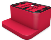
KC39-10075T 145 x 100 x 75