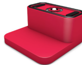
KC39-07075N 145 x 80 x 75